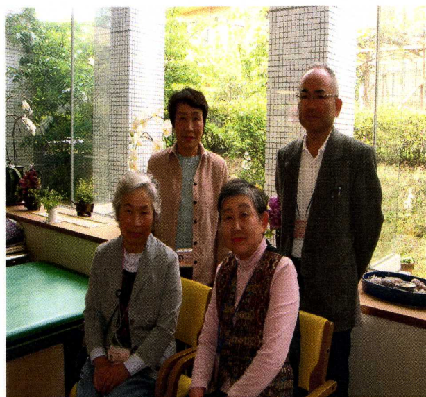
平成21年度 福祉何でも相談員のみなさま

幸いにもこの春『ほほえみの園』は新入職の方々6名に恵まれました。この難しい御時世、大変に嬉しい悲鳴です。この4月5月はまだまだ毎日が戦いの連続なので入居の皆様も、ご家族の皆様もあつたかくそして時に厳しく育ててやっていただくようお願いいたします。